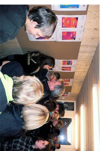
An die Ausstellung in der Stansstader Energiebox kamen viele Leute.